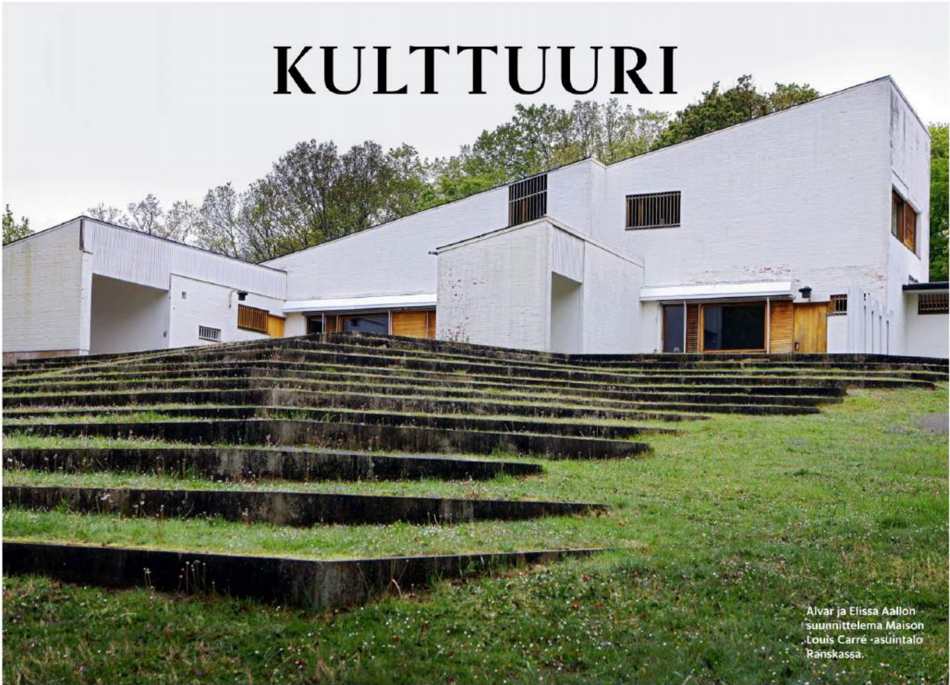
Alvar ja Elissa Aallon suunnittelema Maison Louis Carré -asuintalo Ranskassa.