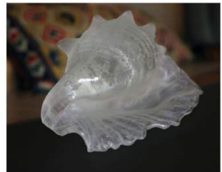
Kapwani Kiwanga: Lambi.