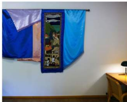
Kapwani Kiwanga: Burning of Cap Français, June 1793.