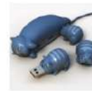
Hub USB en forme de chat

Signifie mon cœur en dialecte arabe, ÉLBÉ est une marque franco-tunisienne fondée par Clémentine Lecointre et Nour Ben Cheikh propose des accessoires de mode conçus et réalisés à la main tout en utilisant des matériaux recyclés: foulards et sacs se parent de motifs rappelant les moucharabiehs . La marque combine inspiration multiculturelles, formes simples et savoir-faire artisanaux.