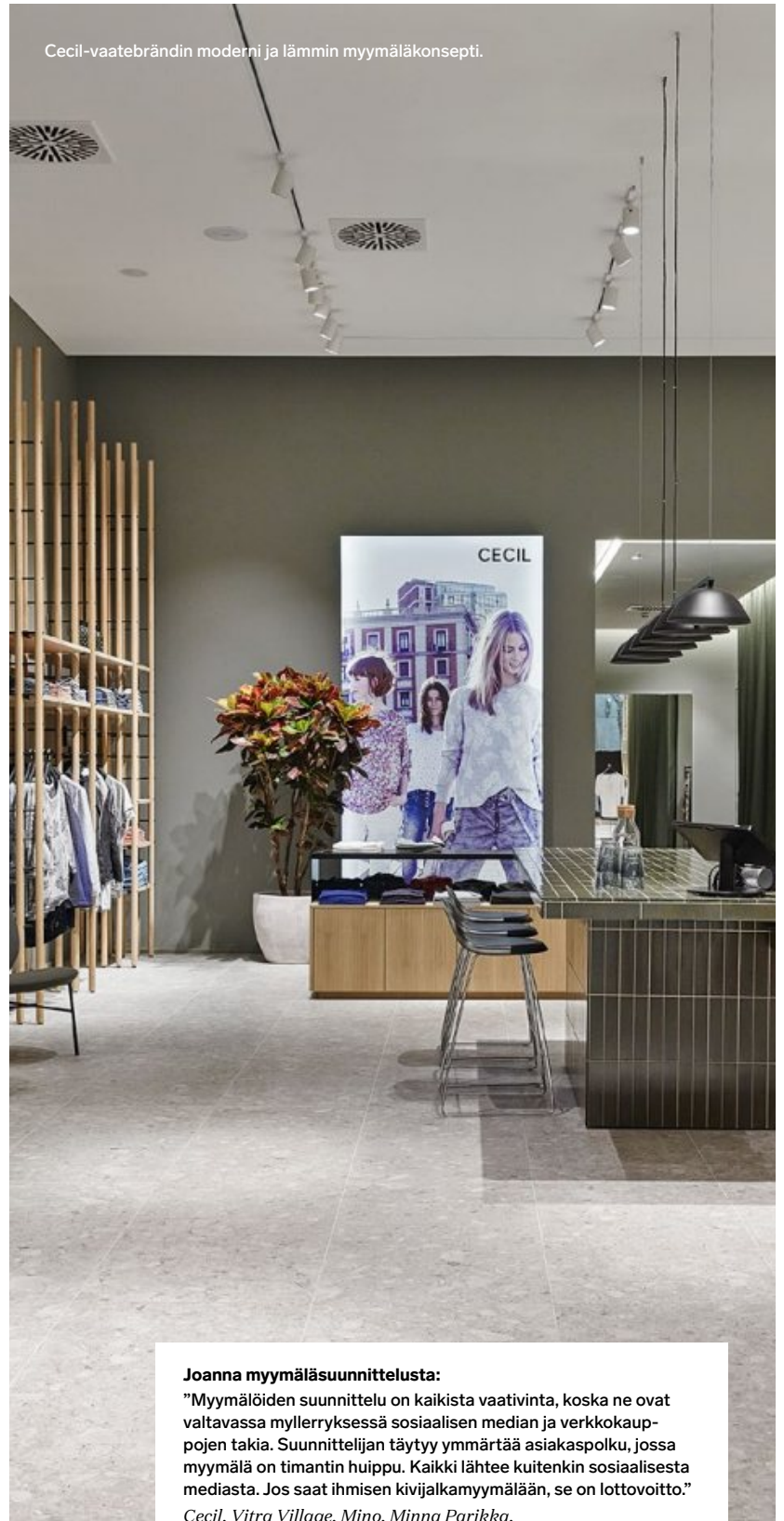
Cecil-vaatebrändin moderni ja lämmin myymäläkonsepti.